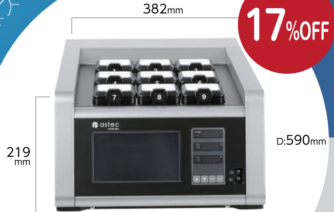
タイムラプスインキュベーター CCM-iBIS-SL