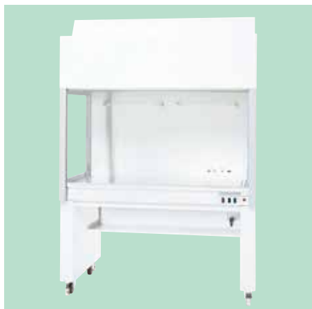
循環方式(片面) AH-100・AH-130・AH-160・AH-180・AH-200