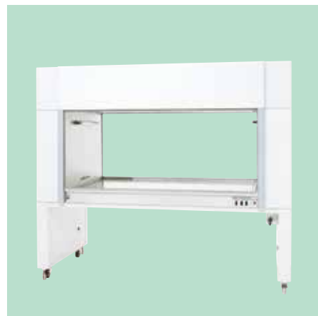
循環方式(両面) AH-205W・AH-205WS (但し、AH-205WSのみ蛍光灯仕様ですので注意してください)