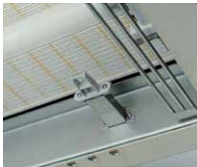
風速センサーとエアーカーテン機構