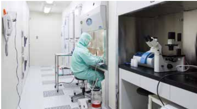
弊社細胞科学研究所での作業風景

外気の侵入、埃や微生物の移動による汚染から細胞培養を行う作業空間の清浄度を確実に守るように設計された壁埋め込み型クリーンルームです。 細胞治療や再生医療に用いるヒト細胞や組織の加工、製造を行う場としてご提案致します。