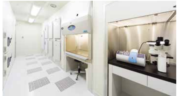
器材を壁に埋め込み気流の障害をできるだけ無くしました